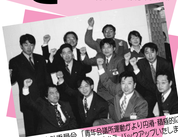
▲総務渉外委員会 「青年会議所運動がより円滑・積極的に 行なえるよう、バックアップいたします。」