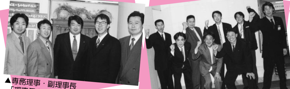
▲専務理事・副理事長 「理事長をしつかりサポートしてゆきます。」

「2000年になる頃には...」小説や映画の中でしばしば夢の暮らしが語られてきたが、まさにその年を迎えた。見渡すことかたの空想を現実に変えてくれそうな新技術が続々と出現し、その事が夢から現実化しそうである。しかし、現在の私達の周りには技術の進歩だけでは解決できない問題として環境問題や福祉問題、経済問題などが山積している。なぜ、こんなに大きな、たくさん課題が残ってしまったのだろう。振り返ってみれば20世紀は満たしても満たしてもさらに肥大する『欲』との葛藤の時代だったのかもしれない。それはまるで、幼い子どもがおもちゃを自分が使いたがために、奪い合い喧嘩を始めてしまうように...。そして、いつの間にか自分と他人や社会との幸せは相反するものだと思ひこんでしまっていたのかもしれない。今やっさと、私達は様々な失敗と多くの犠牲の中からこれらの課題を解決するには自分の立場だけで行動を起こすのではなく、自分と他人、自分と社会そして地球のプラスが相伴う活動、調和のとれた行動、すなわち、『欲』に左右されない『高い志』が必要な事に気づいたのではないだろうか。そしてこれが、新技術と融合したときに夢の21世紀、『ミレニアム・ドリーム』が本当に現実のものとなるのであろう。この2000年が21世紀に向けての確実なステップになることを願う。