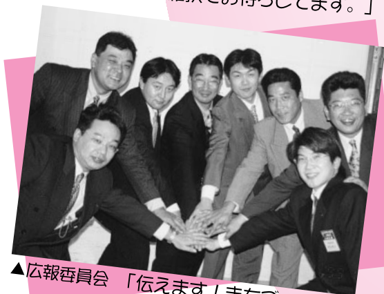
▲広報委員会 「伝えます! まちづくり情報」