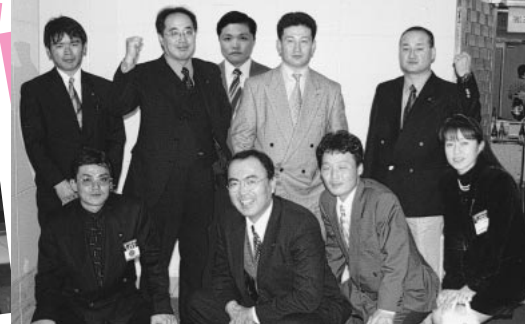
▲会員拡大研修委員会 「様々なセミナーを通して会員の能力アップを図ります。」