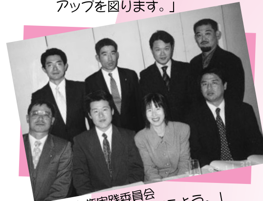
▲地域主権実践委員会 「合併をみんなで考えよう。」