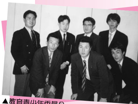
▲教育青少年委員会 「わんぱく相撲でお待ちしています。」