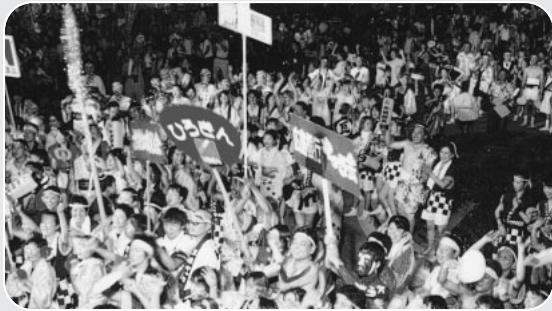
祭りを通してまちづくりを考えるため、三原やっさ祭りに参画しています。