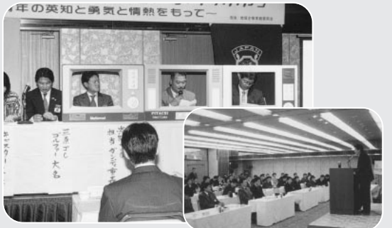
毎月1回行う例会において、様々な研究・研修を行っています。