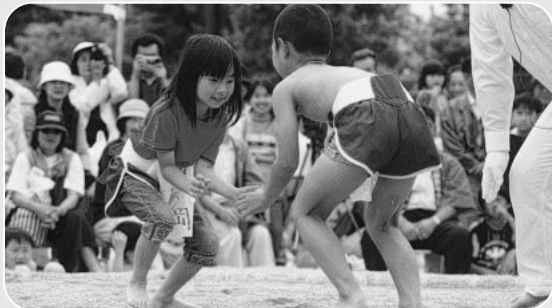
青少年の健全育成を願い、わんぱく相撲三原場所を開催しています。