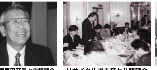
リサイクルで未来クル憩談会

私たちの住む「まち」は、海も山もあり比較的環境に恵まれていると思いがちですが、これまで経済優先で大量生産・大量消費・大量廃棄を繰り返した結果、地球規模で環境破壊が進行し、私たちの廻りにも、山が枯れ・海砂問題に象徴される海洋汚染や破壊、またゴミ問題やダイオキシン問題など目に見えないところで、私たちの体に忍び寄って来ています。これを解決するためには個人一人ひとりの意識改革が必要となります。今年一年(社)三原青年会議所では、リサイクルで未来クル憩談会の方々と一緒に、ペットボトルの自主回収を始めました。これも市民皆様のご協力のおかげで徐々に浸透して参りました。この様に個人一人や団体だけでは不可能なことも、ネットワークする事で一歩前進できたと思います。また「みはら」には、桜山に