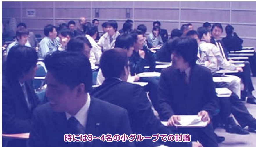
時には3~4名の小グループでの討論