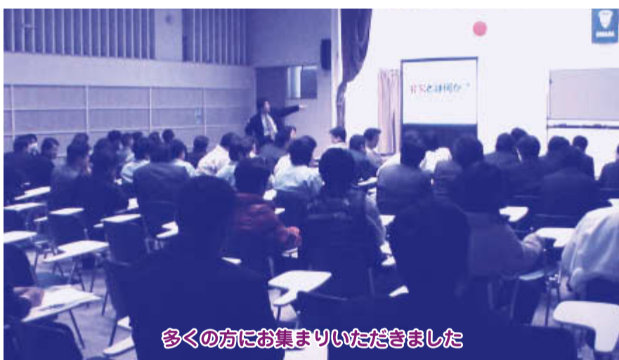
多くの方にお集まりいただきました