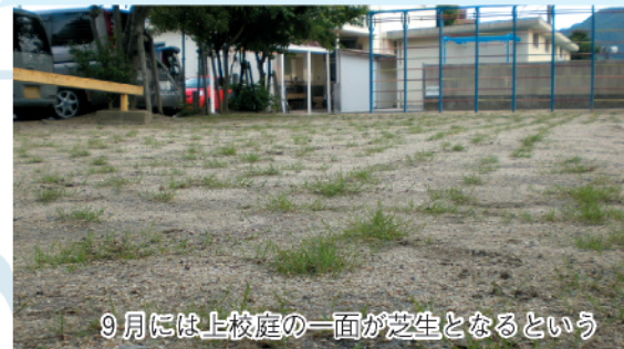
9月には上校庭の一面が芝生となるという

現在は、水やりを行ない、順調な成長を待っている状態であるが、上校庭の芝生化が完成した後は、グラウンドの周囲にも芝生を植えてゆきたいなど、さまざまな夢が生まれてゆく。